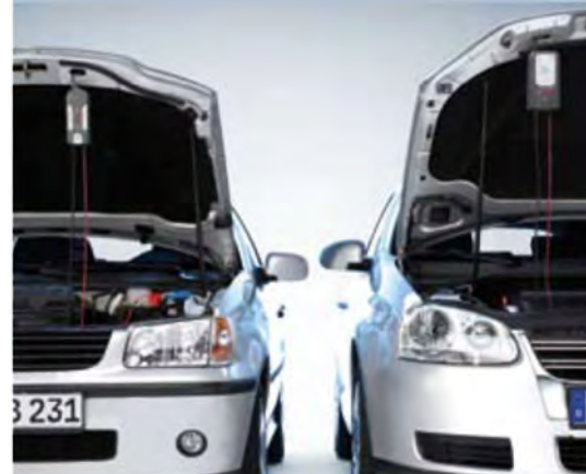
Vgradni kavelj je primeren za oba polnilnika, C3 in C7. Hitra in preprosta mobilna uporaba