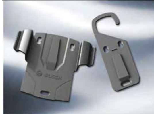
Primerno za C3 in C7: vgradni nosilec ali kavelj