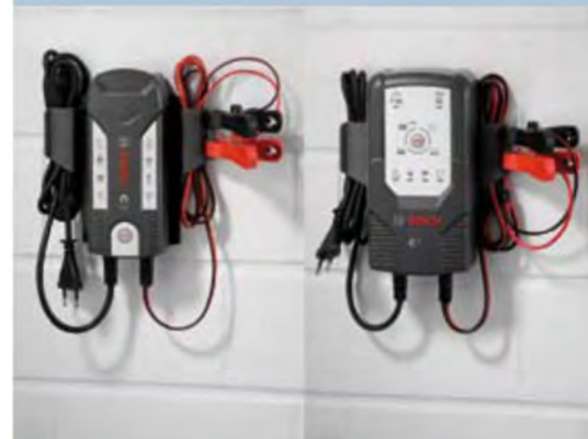
Vgradni nosilec je primeren za oba polnilnika, C3 in C7. Praktično shranjevanje kablov in sponk.